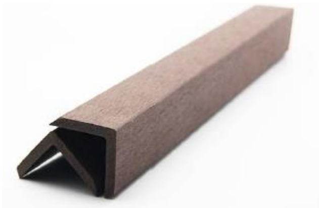
Angolare fi finitura

Prodotto conforme ai requisiti standard EN 13329:2000 EN 13986:2004