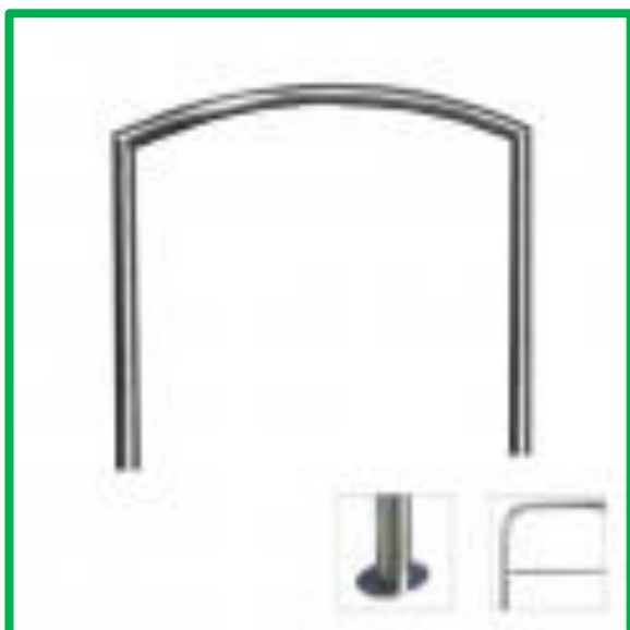
Archetto ribassato ø mm 76 – Codice DS036

Realizzato in acciaio inox AISI 304, finitura satinata, spessore 20/10. Modelli disponibili: interrato, con piastra. Può essere fornito con barra di rinforzo. Dimensioni: cm 110X120h