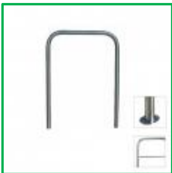
Archetto ø mm 48/50 – Codice DS030

Realizzato in acciaio inox AISI 304, finitura satinata, spessore 20/10. Modelli disponibili: interrato, con piastra. Può essere fornito con barra di rinforzo. Dimensioni: cm 110X120h